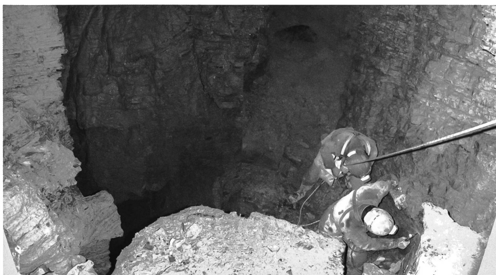
Foto 4 – Abisso Cappa 1 : si tratta della grotta con i più grandi volumi del Monte Generoso. Il fenomeno dei pseudo-edocarso è evidente nei grandi pozzi iniziali. L'immagine mostra il primo vasto pozzo dove si getta un ruscello temporaneo. Se i fantômes de roche sono predominanti nei pozzi, tra un pozzo e l'altro si trovano grandi meandri indici di carsismo «classico».