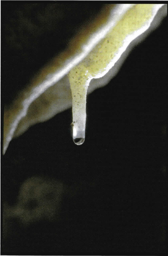
Foto 5. Concrezione a spaghetto . La goccia d'acqua depone i sali minerali e la stalattite cresce, goccia dopo goccia.