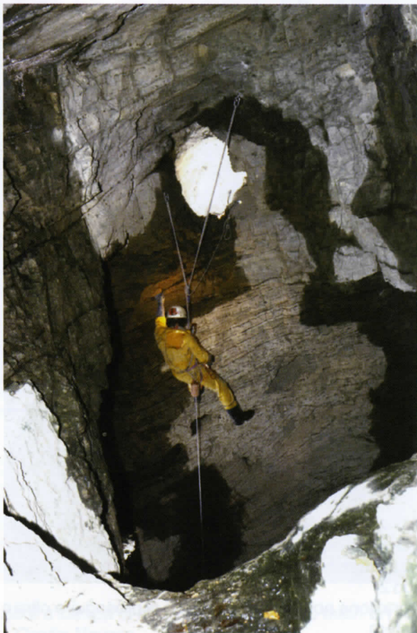
Foto 1. Buco della Sovaglia . Discesa del pozzo iniziale di 21 m.

Il Monte Generoso è un'area naturalistica e carsica straordinaria, ricca di morfologie erosive, di sorgenti e grotte. Le acque che cadono sulla montagna vengono drenate sottoterra, alimentando fiumi sotterranei che scorrono in gallerie, sale e pozzi, creati dall'azione millenaria dell'acqua. L'acqua scolpisce e cesella la roccia, creando labirinti e intrecci di forre sotterranee, ricamando arabeschi di calcite con effetti cromatici talora stupefacenti in un mondo che pare fatato.